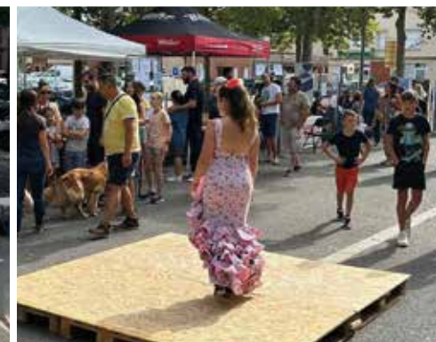
LE FORUM DES ASSOCIATIONS SUR L'ESPLANADE BELLECOURT