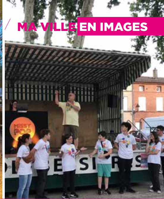
LES ESCALES GOURMANDES - LES RENDEZ-VOUS FESTIFS & CULTURELS DE L'ÉTÉ